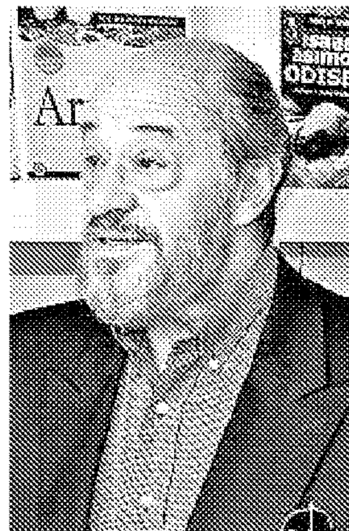
Fernando Jiménez del Oso en la Feria del Libro de 2004